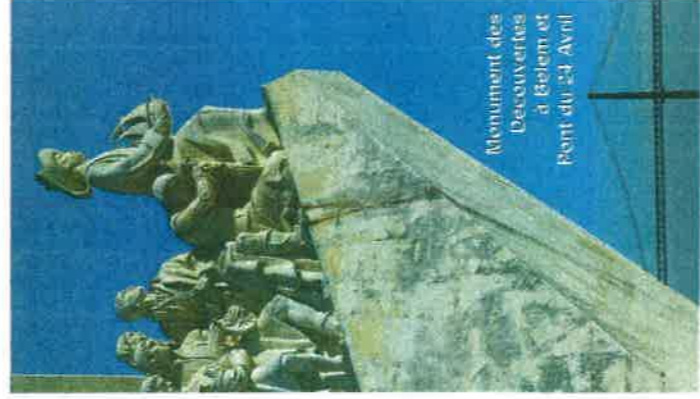
Monument des Découvertes à Belem et Pont du 24 Avril

Vous pourrez y admirer la synagogue Shaaré Tikvá datant du tout début du XXe siècle, vous arrêter près de la place Rossio de Lisbonne où des milliers de juifs ont tragiquement trouvé la mort au Moyen-Âge. Vous découvrirez comment ceux et celles refusant le christianisme furent brûlés sur des bûchers par l'Inquisition catholique.