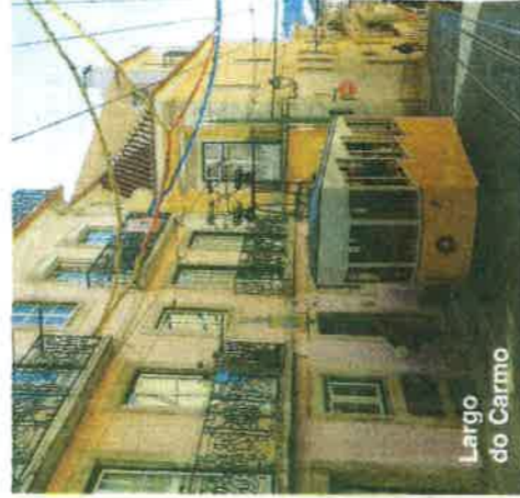
Largo do Carmo