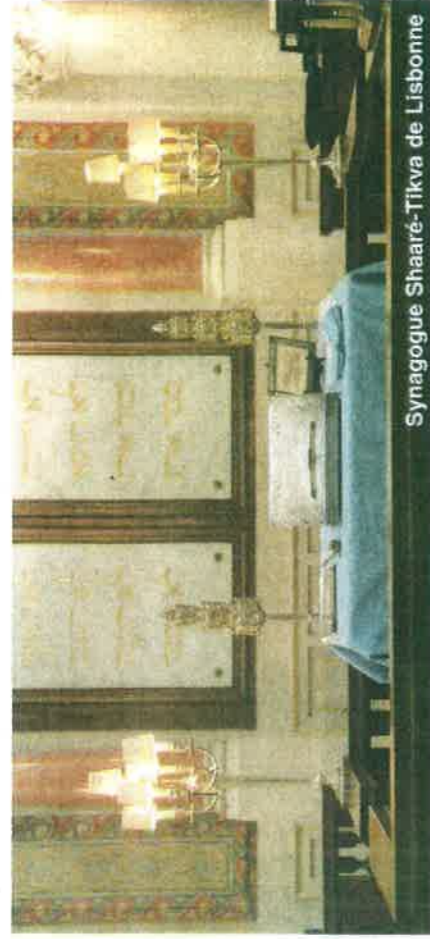
Synagogue Shaaré-Tikva de Lisbonne

La visite se déroule du dimanche au Jeudi, par petits groupes qui n'excèdent pas 8 personnes et il est également possible d'organiser une visite totalement privée. Mais la réservation est essentielle. Car les visiteurs sont aujourd'hui présents à Lisbonne toute l'année. Il suffit de passer un chabbat dans la capitale portugaise, pour découvrir chaque vendredi au début du chabbat, la splendide synagogue de Lisbonne qui s'anime de discussions en français, anglais, portugais, hébreu... Lisbonne est vraiment devenue le rendez-vous des juifs du monde entier. Et si vous avez de la chance, peut-être pourrez-vous découvrir la