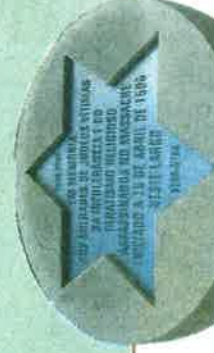
memorial aux juifs massacrés en 1506. Plaza Sao Domingo

Vous apprendrez le rôle incroyable et sur-tout inconnu de la communauté juive de Lisbonne pendant la Seconde guerre mondiale. Mais aussi, l'histoire des Marranes portugais, dont les marques sont toujours vivantes aujourd'hui dans le pays, pour ceux qui savent en découvrir les codes.